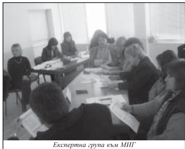
Експертна група към МИГ