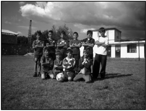
/ 2006 .